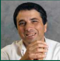
פרופ' יורם לוזון