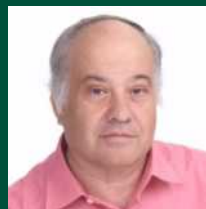
פרופ' רון אונגר