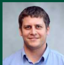
פרופ' ארז לבנון