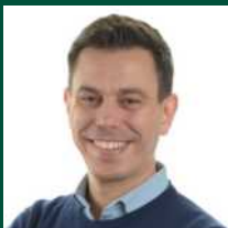
ד"ר רונן טל-בוזר מנהל התוכנית

מטעם המרכז הרפואי שיבא חוקר רפואה מותאמת אישית וגנומיקה; מנהל המרכז לחקר סרטן; חתן פרס ישראל [אתר]