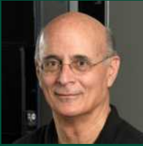
פרופ' גידי רכבי