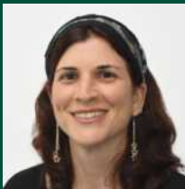
פרופ' מלי שלמון-דיבון