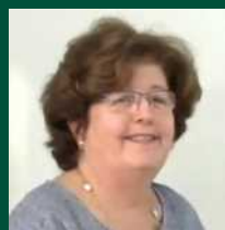
פרופ' נינט אמריליו